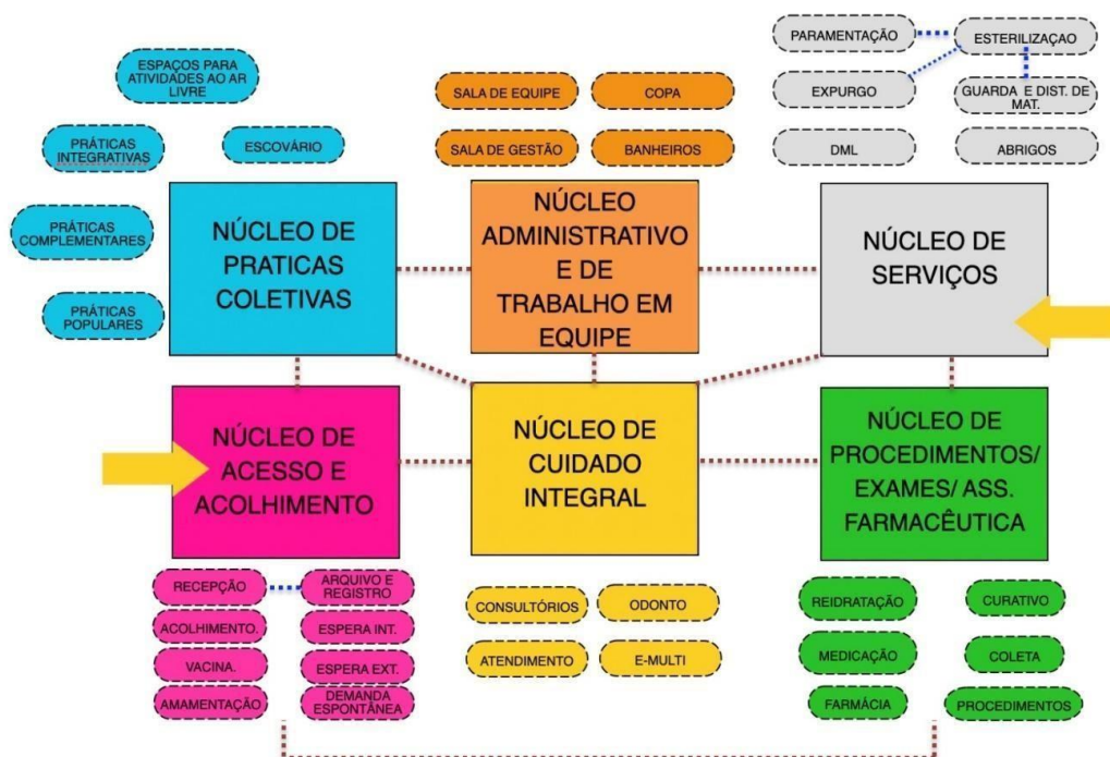
Figura 1: Diagrama de Massas